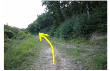
Llegamos junto a una finca labrada y la seguimos en ascenso hasta su final.