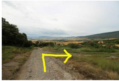
Abandonamos el camino que traíamos y comenzamos a rodear el monte.