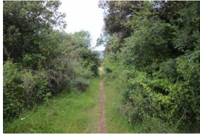
El camino compagina senderos y pistas.