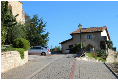
Salimos por la parte alta del pueblo.