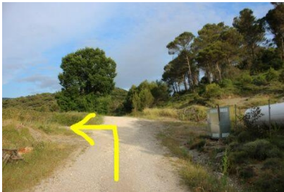
Cuando el ascenso se suaviza giramos a la izquierda, en descenso.