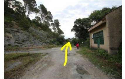
Poco antes de la caseta de aguas, volvemos por el mismo camino hacia Olza.