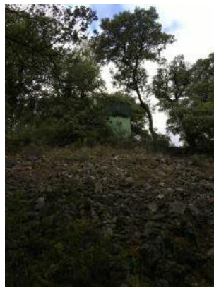
Veremos una palomera a nuestra izquierda en alto. La cantera está cerca.