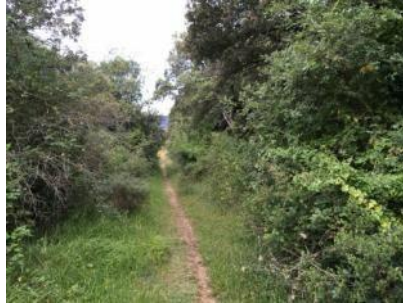
Desde el desvío, el camino se vuelve en sendero en ascenso.