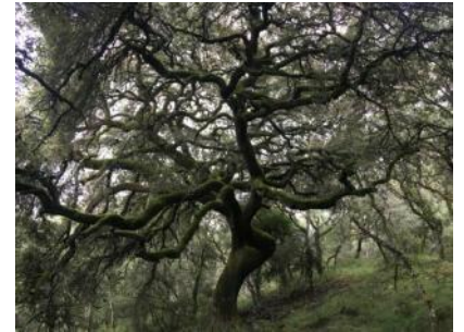
Bosque junto a la cantera.