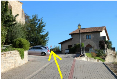
Salimos por la parte alta de Olza.