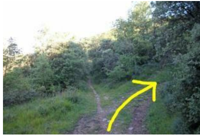
Atención al desvío hacia la cantera.