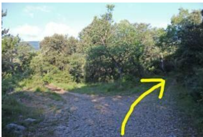
Tomamos el camino señalizado hacia "Lete".