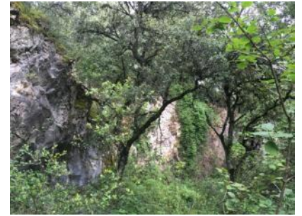
Podemos pasear por la cantera. Son tres extracciones cercanas en tres de las vertientes de la parte alta del monte.