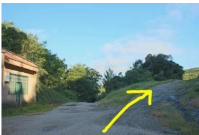
A la altura del depósito de aguas, nos desviamos a la derecha.